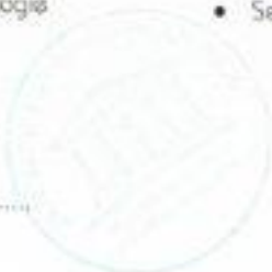
HP Reinhold Thoma Schul- und Ausbildungsleitung